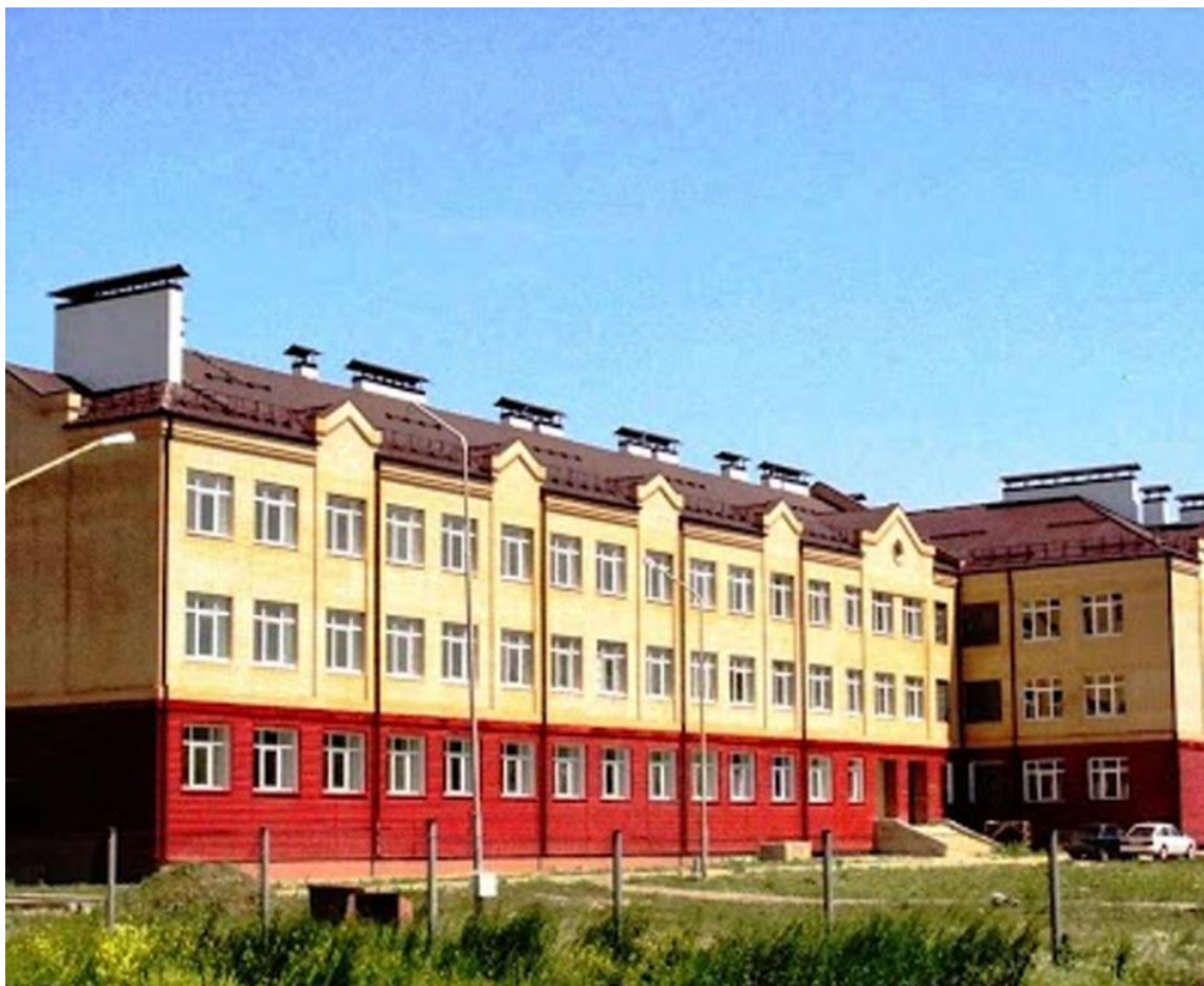
МБОУ СОШ № 16